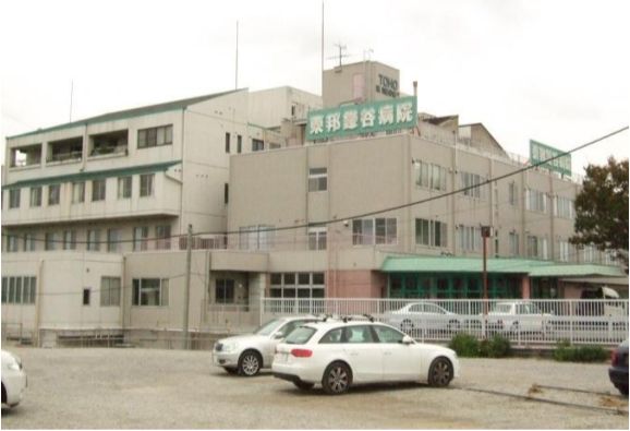
東邦鎌谷病院 全景

東邦鎌谷病院では、今インフルエンザの予防接種を行っております。周りの病院では予約が必要になる事が多いですがこちらにはそれが不要です。しかも専門スタッフによる接種の為、とてもスピー