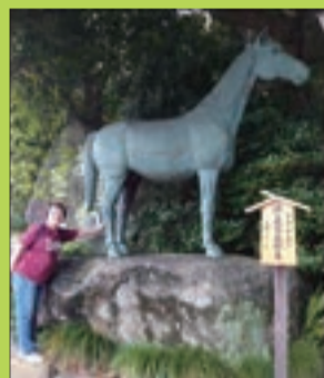
私の身長は152センチです。 大きい馬の像です。