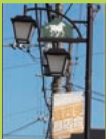
商店街の モチーフ