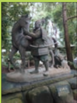
いろいろな 狛犬があります

所在地 流山市駒木 655 番地 電話番号 04-7154-7377 定休日 なし