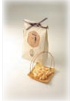
十勝チーズ 25g×4袋入り