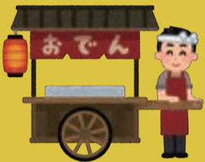
いつか二ういう屋台でおでんを食べてみたい。